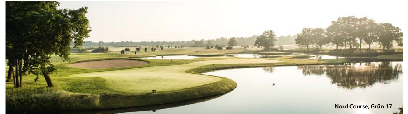
Nord Course, Grün 17