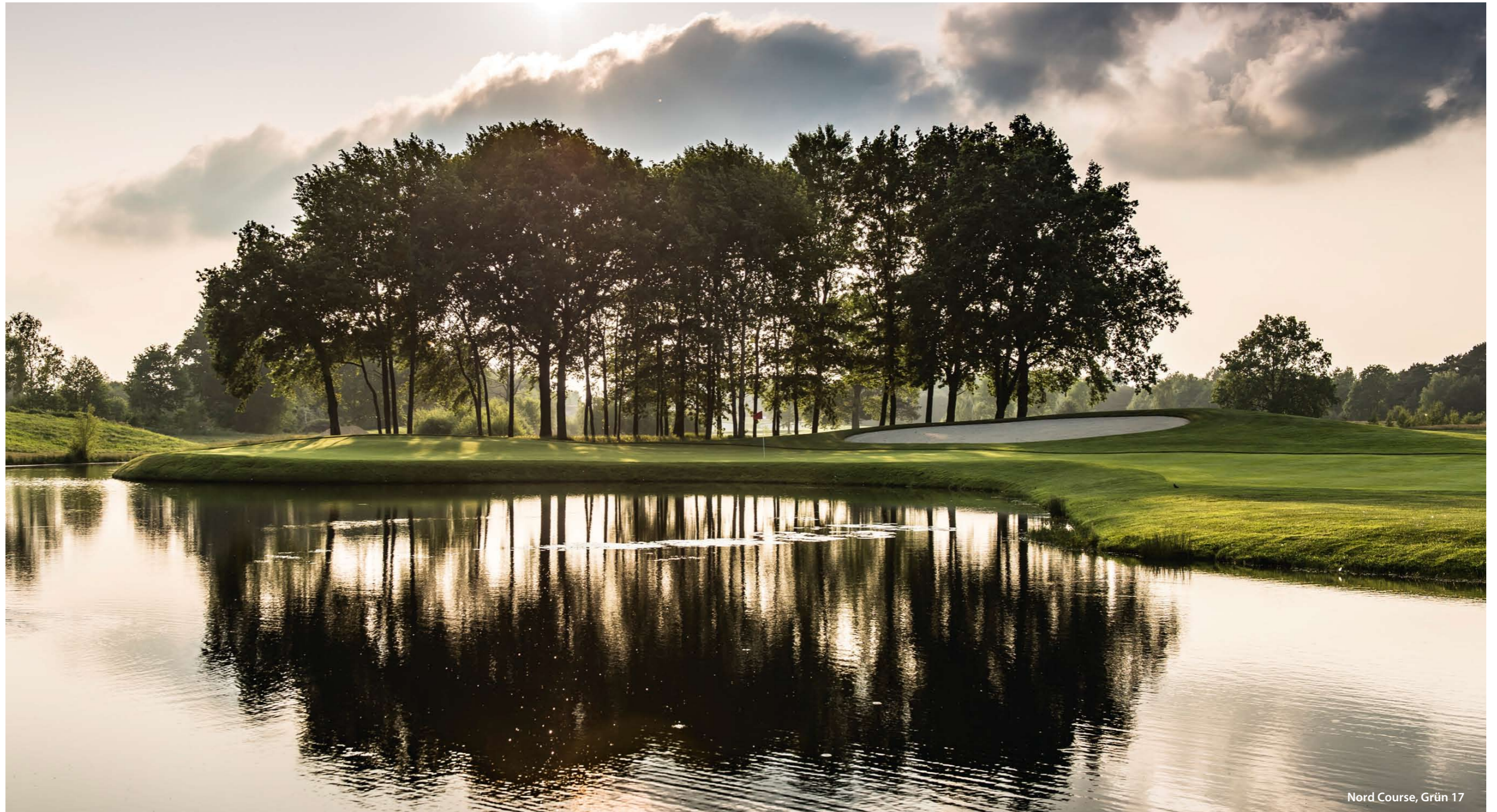
Nord Course, Grün 17