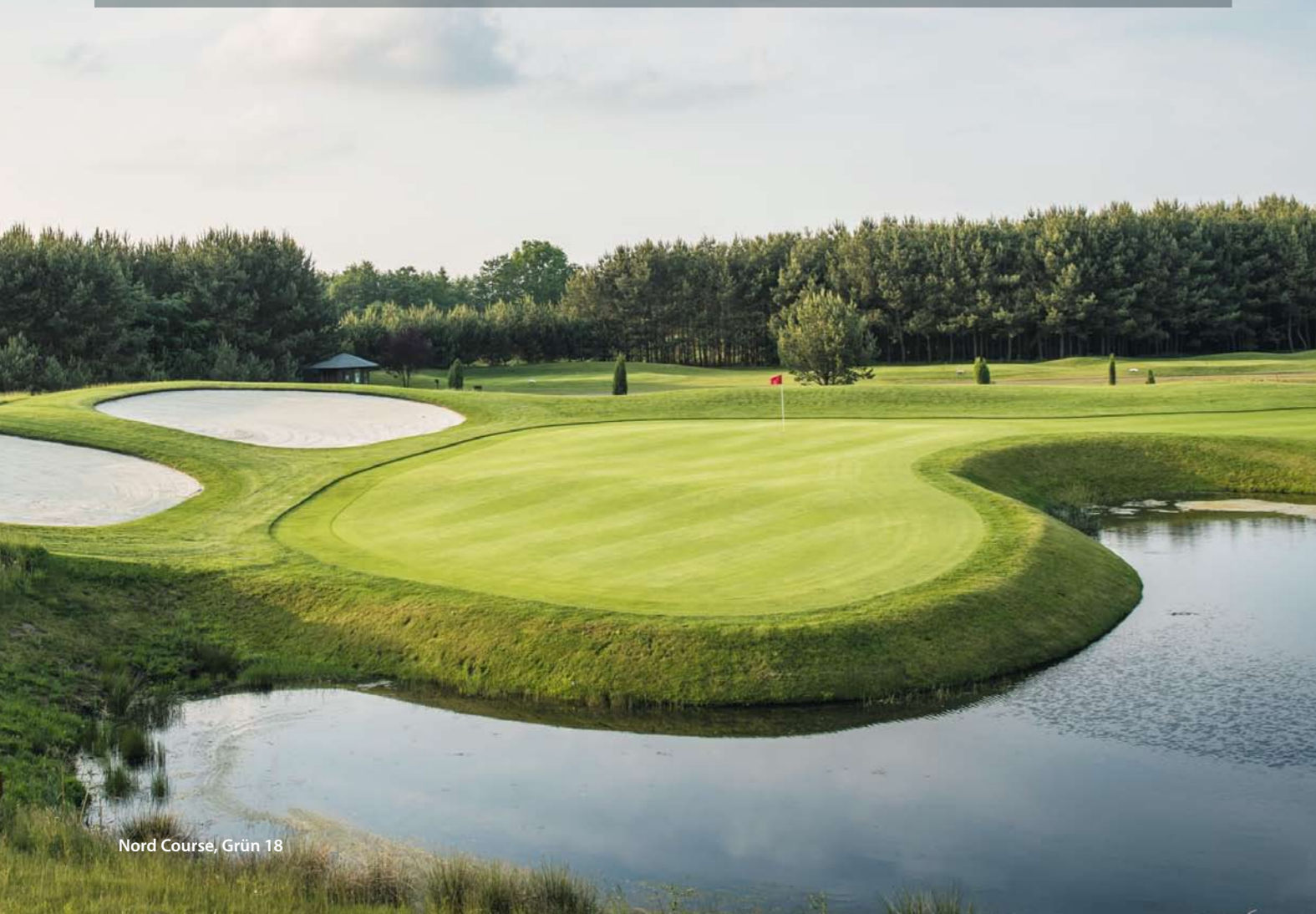
Nord Course, Grün 18

Nach vier Jahren Bauzeit wurde der Nord Course 2008 eröffnet und etabliert sich seit Jahren im professionellen Golfsport. Als Ausrichter diverser internationaler Turniere konnten wir wichtige Erfahrungen sammeln, die wir ständig in die Weiterentwicklung unserer Anlage und insbesondere des Nord Courses einfließen lassen.