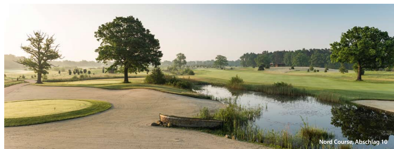
Nord Course, Abschlag 10