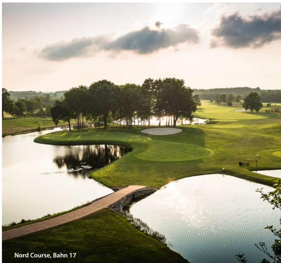
Nord Course, Bahn 17

Der Nord Course erstreckt sich über insgesamt 86 Hektar und wurde von Anfang an darauf ausgerichtet, die Bedürfnisse internationaler Profiturniere zu erfüllen. An jedem Loch stehen vier Abschläge zur Auswahl, welche für jede Spielstärke die passende Herausforderung bieten. Gemäß dem Course-Rating ist der Nord Course vom Champions-Tee der schwerste Platz Deutschlands. Die Fairwaybunker befinden sich in Entfernungen von 240 bis 320 m vom Champions-Tee und somit strategisch in der Drivelänge internationaler Golfprofis.