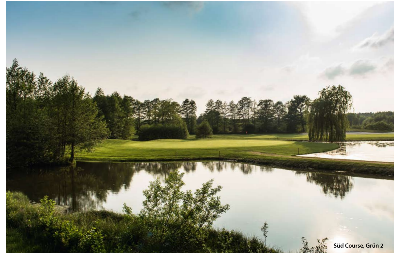
Süd Course, Grün 2