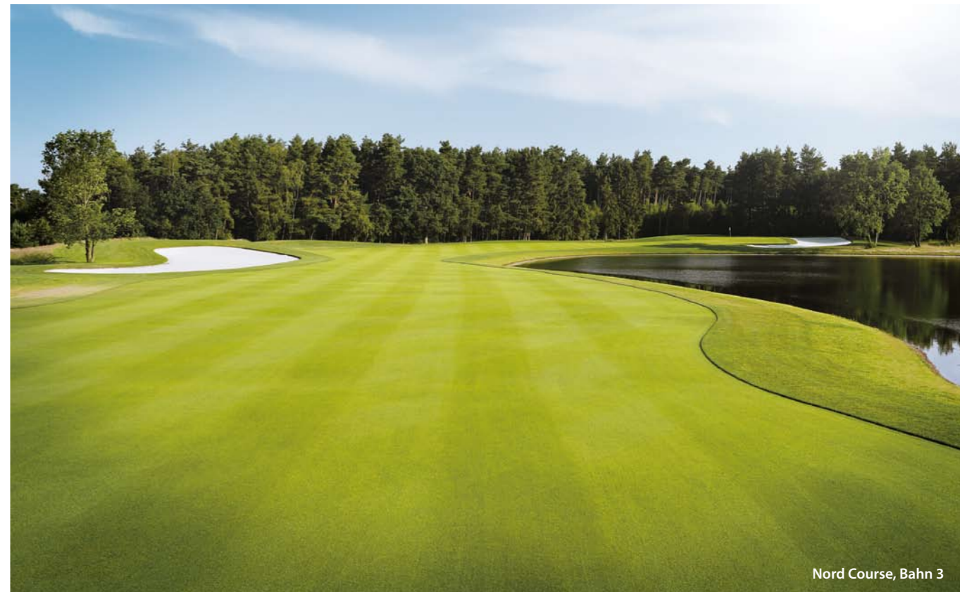
Nord Course, Bahn 3