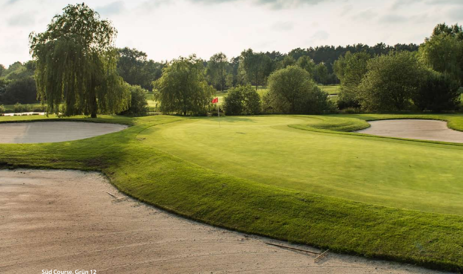
Süd Course, Grün 12

ter Baumbestand prägen den parkähnlichen Charakter. Gerade in den frühen Morgenstunden zeigt sich der Süd Course Naturfreunden von seiner schönsten Seite. Viele seltene Vogelarten haben rund um den Süd Course ein neues Zuhause gefunden. Gewachsene Landschaften und Wasserflächen sorgen für Entspannung.