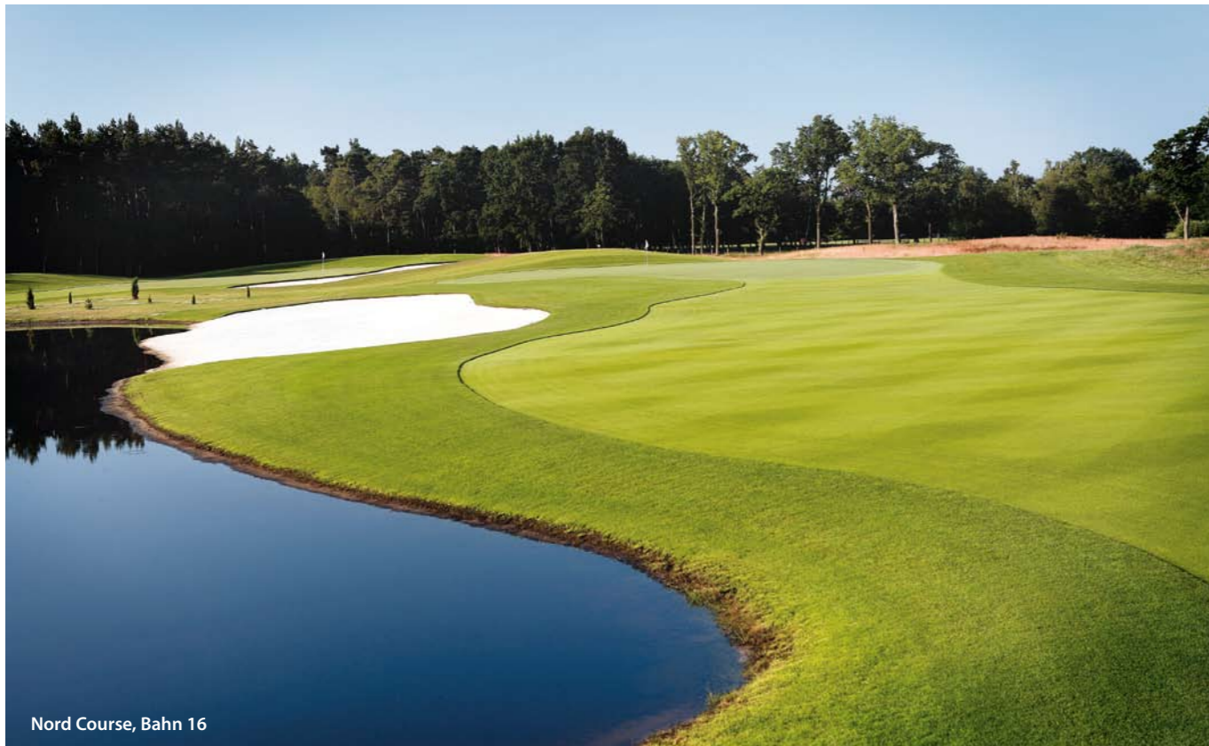
Nord Course, Bahn 16